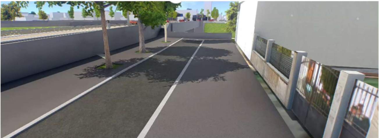
Vue de l'impasse Gallieni à l'issue des travaux du T1