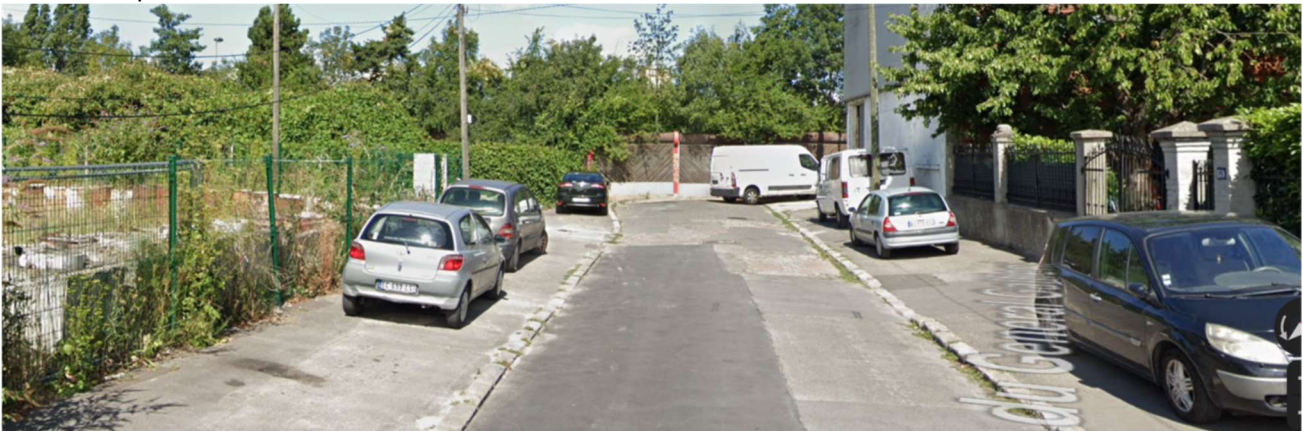
Vue de l'impasse Gallieni avant les travaux du T1