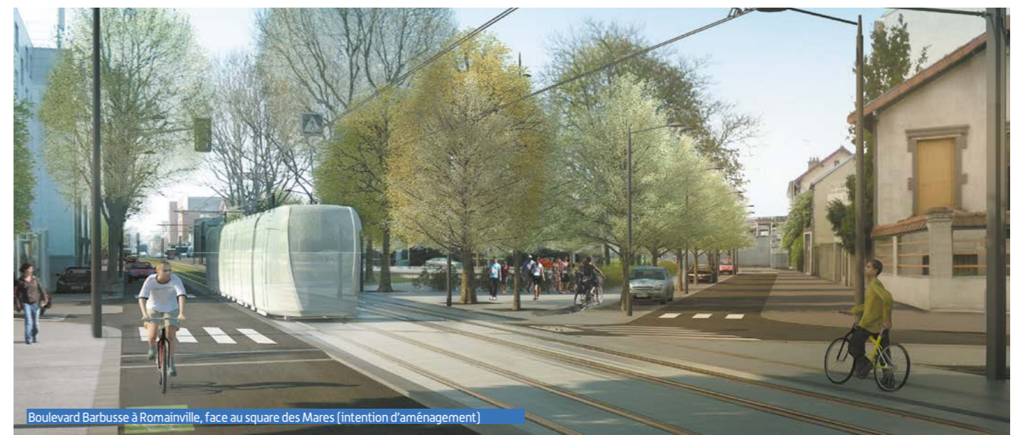
Boulevard Barbusse à Romainville, face au square des Mares (intention d'aménagement)

Le square sera réaménagé pour en faire un lieu de détente plus agréable pour les riverains. Une vingtaine de nouveaux arbres seront plantés pour l'agrémenter. Les enfants des trois établissements scolaires à proximité pourront profiter des jeux qui y seront installés.