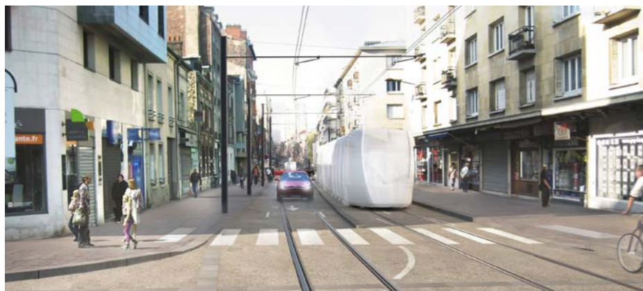
Rue Jean Jaurès (intention d'aménagement)

Une commission de règlement à l'amiable indépendante sera mandatée pour proposer une indemnisation aux commerçants dont le chiffre d'affaires aura été impacté directement par les nuisances imputables au chantier. L'agent de proximité aidera alors les commerçants dans les démarches administratives permettant d'obtenir une indemnisation, le cas échéant. Une enveloppe significative est ainsi budgétée par les maîtres d'ouvrage. A titre d'exemple, lors des chantiers des tramways T1 Ouest, T5 et T8, une centaine de dossiers ont été indemnisés pour un total de 1,8 million d'euros.